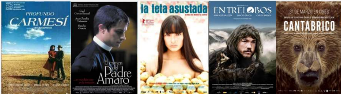
Profundo Carmesí (1996)